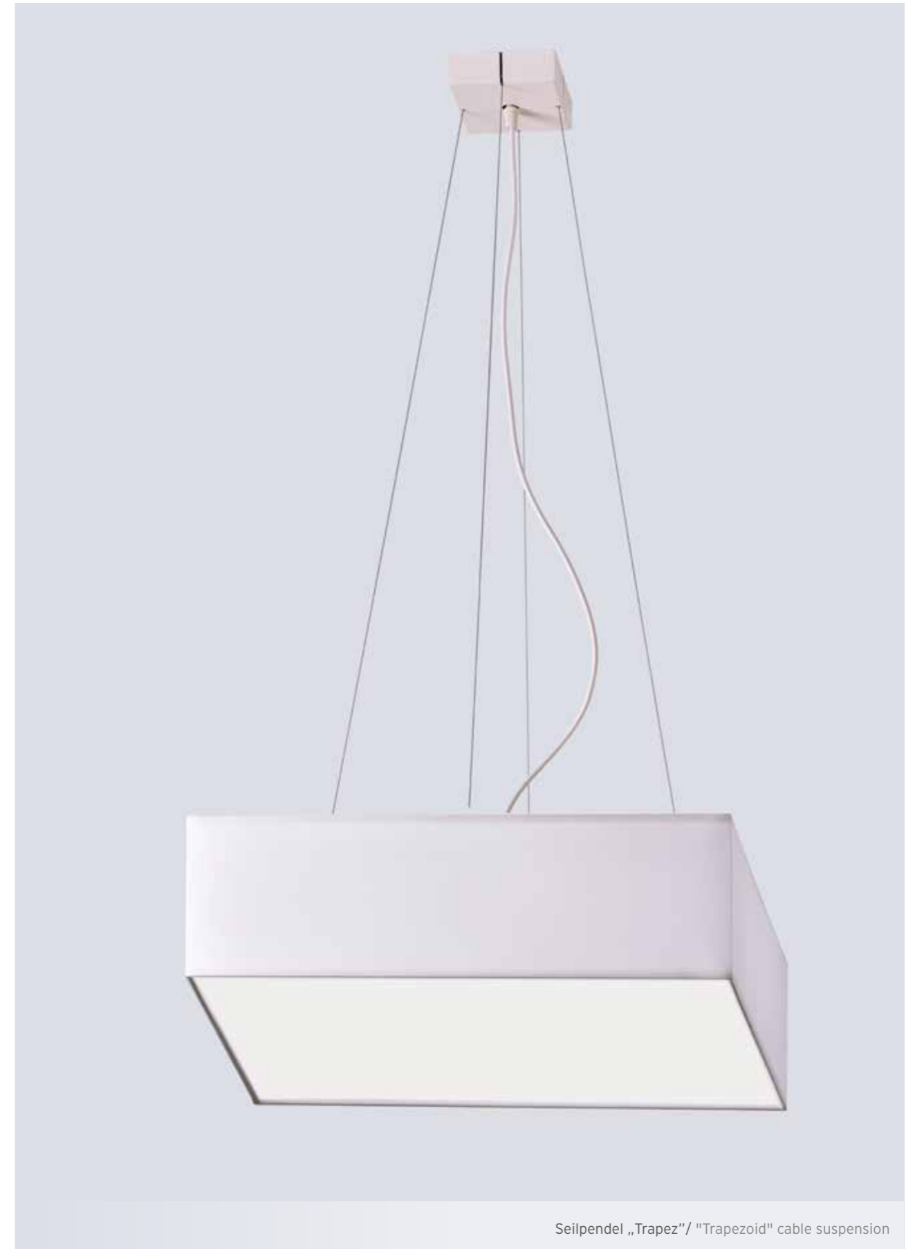
Seilpendel „Trapez“/ "Trapezoid" cable suspension