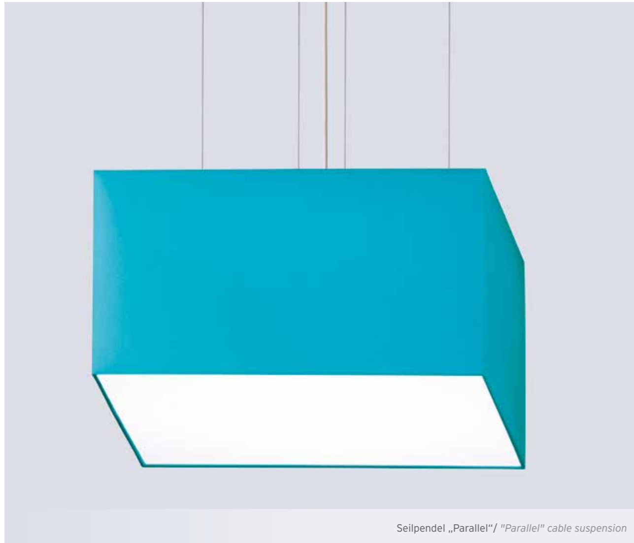
Seilpendel „Parallel“/ "Parallel" cable suspension