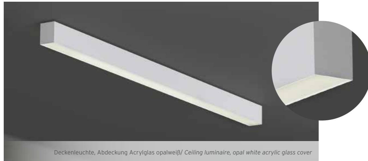
Deckenleuchte, Abdeckung Acrylglas opalweiß/ Ceiling luminaire, opal white acrylic glass cover