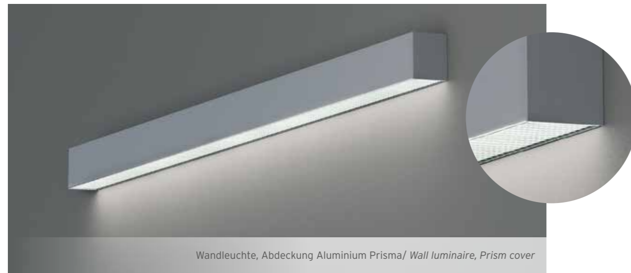
Wandleuchte, Abdeckung Aluminium Prisma/ Wall luminaire, Prism cover