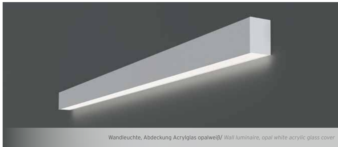
Wandleuchte, Abdeckung Acrylglas opalweiß/ Wall luminaire, opal white acrylic glass cover